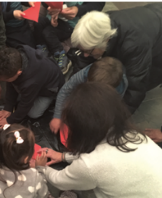
Fiire mit de Chliine, Kinder, Eltern und Grosseletern beim Spiel