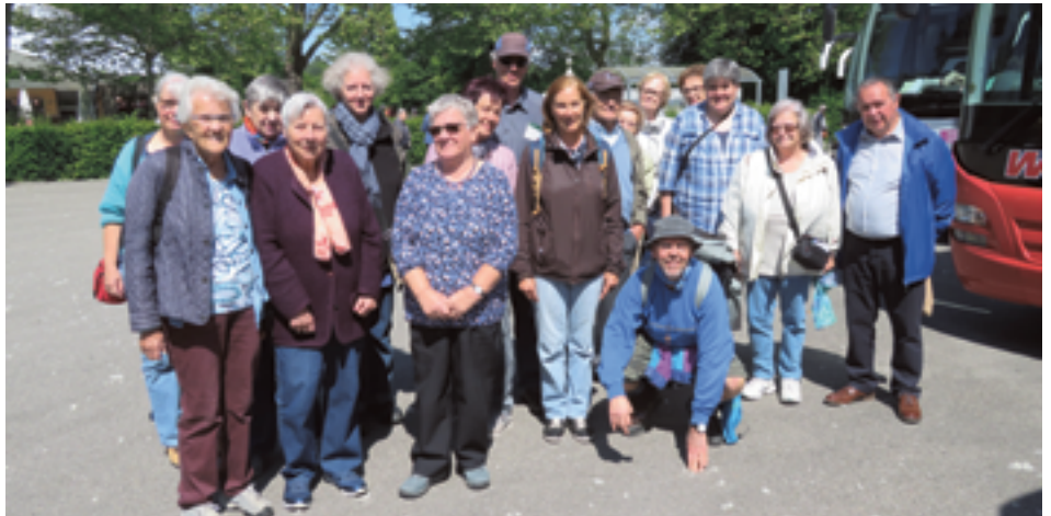
Freiwilligenausflug, Reisegruppe vor dem Bus

Im Juni waren die freiwilligen Helferinnen und Helfer zu ihrem traditionellen Ausflug eingeladen. Diesmal ging die Reise zur Blumeninsel Mainau in einen der schönsten Parks weltweit, der den Besucherinnen und Besuchern dann auch ein prachtvolles Blütenmeer bot. Eigentlich hätten die Rosen begeistern sollen, doch Tage zuvor hatte es so stark geregnet, dass die meisten Blüten tropfnass die Köpfe hängen liessen. Trotzdem herrschte, wohin man auch blickte, eine wundervolle Farbenpracht über der Blumenvielfalt. Um die ganze Insel zu erkunden, fehlte die Zeit. Der Aufenthalt war aber auch so abwechslungsreich und wundervoll.