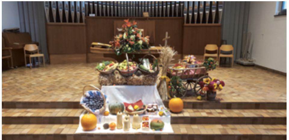
Erntegaben am Erntedankgottesdienst