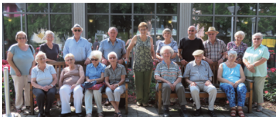
Ferien 59+, Feriengruppe 2019