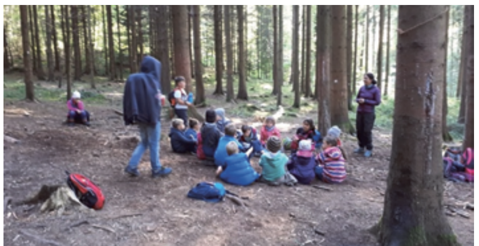
Waldlebnistage, Kindergruppe im schlieremer Wald