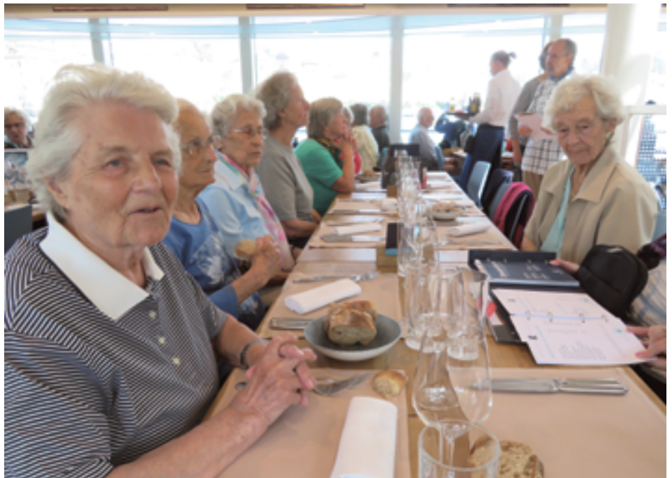
Ausflug für Alle, Mittagessen auf dem Schiff

Grossen Aufwand verursachte die im Rahmen des Schlierefäschts arrangierte Ausstellung «Hoffnungsträger». Dafür hinterliess sie auch grossen Eindruck und Begeisterung bei allen Besucherinnen und Besuchern. Von der im «Buchparadies» angebotenen Bestellmöglichkeit für ausgestellte Bücher zum Thema wurde rege Gebrauch gemacht. Die Webseite