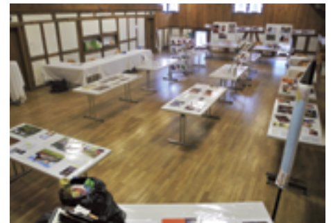
Schlierefäscht, Ausstellung «Hoffnungsträger»