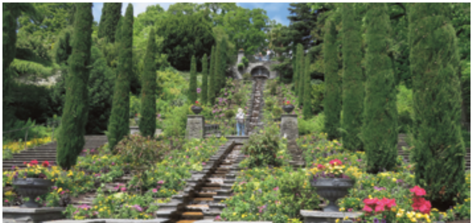
Freiwilligenausflug, bunte Bepflanzung der Wassertreppe im Parkgarten

Schön, wenn man solch wunderbare, friedliche Ferien nochmals in Erinnerung rufen kann. Wir, eine kleine Gruppe von 17 Personen, durften vom 23. Juni bis zum 2. Juli 2019 zehn Tage in Bad Krozingen/D im Hotel Eden an den Thermen geniessen. Ja, es waren genussreiche Ferien, erlebnisreiche Tage, angefangen mit einem reichhaltigen Frühstück, ausgefüllt mit Spaziergängen, Bummeln und «Lädele», Verweilen im grossen Kurgarten oder Baden in der Therme. Wegen der sonnigen, fast schon tropischen Hitzetage suchten wir gerne Schattenplätze auf. Angenehm waren die abwechslungsreichen Ausflüge im klimatisierten Bus. Die erste Fahrt führte uns durch das Elsass in die Vogesen zur Ferme-Auberge-Glasborn, die zweite durch das Glottertal bis zum Titisee mit kleiner Schifffahrt und zurück über das Höllental-Freiburg-Bad Krozingen, und eine Nachmittagsfahrt brachte uns durch den Kaiserstuhl zu Kaffee und Dessert. Nach den vorzüglichen Abendessen zog es uns jeweils ins Freie auf die Terrasse, wo uns die kühlere Luft wohl tat und wir es uns bis in die Nachtstunden hinein gutgehen liessen. Es wurde viel erzählt und gelacht. Die Ferien 2019 werden sicher zur bleibenden Erinnerung.