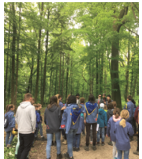
Cevi-Schnuppertag, gemischte Cevi-Gruppe im Altstetterwald