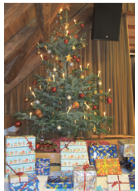
Geschenkaktion, Geschenke unter dem Christbaum