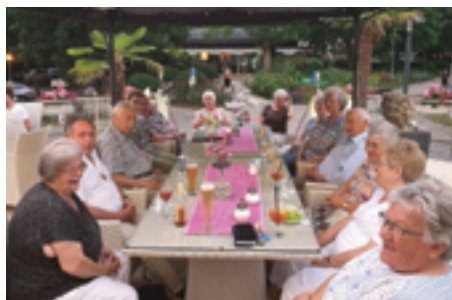
Ferien 59+, fröhliche Tischrunde auf der Hotelterrasse