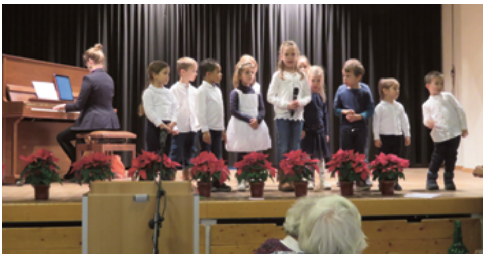
Kinderchor, Auftritt im Stürmeierhuus

2019 durften wir wieder neue Kinder im Chor begrüßen. An 38 Dienstagabenden probte eine gut durchmischte Gruppe mit jeweils etwa 15 Jungs und Mädels fleissig für unsere sechs Jahresauftritte. Der erste fand im März am Spaghettisonntag statt, es folgte im Mai der Auftritt am Muttertag, im Juni sangen wir am Kinder-Sommerfest und im September traten wir am Schlierefäscht auf. Im Dezember hatten wir gleich zwei vorweihnachtliche Einsätze: so sangen wir anlässlich der alljährlichen Adventsfeier für Alle und schliesslich begleiteten wir am dritten Adventssonntag unsere Kinderweihnacht, an der wir auch das Eintreffen des Friedenslichtes miterlebten konnten.