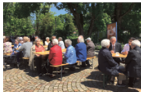
Fröhliches Beisammensitzen zur Grillade nach dem Auffahrtsgottesdienst