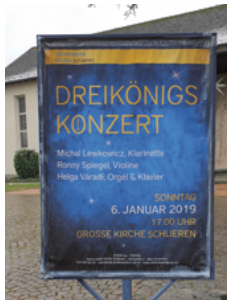
Einladung zum Dreikönigskonzert