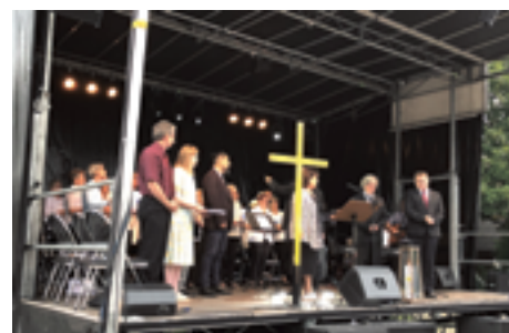
Gottesdienst der christlichen Religionen am Schlierefäscht