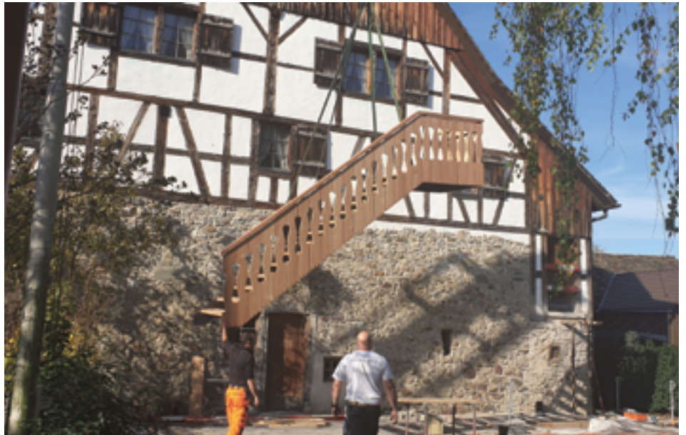
Stürmeierhuus, Ersatz der Fluchttreppe

An der Kirchgemeindeversammlung vom 6. Juni wurde ein Kredit von Fr. 156'000 für die Ausschreibung eines Architekturwettbewerbes für einen Neubau bewilligt. Zur Vorbereitung des Wettbewerbprogrammes waren verschiedene baurechtliche und grundbuchamtliche Abklärungen vorzunehmen. Als dann konnten die Programme für die Präqualifikation und den eigentlichen Wettbewerb erstellt werden. Rechtzeitig vor Jahresende lag alles zum Startschuss für die Ausschreibung in der ersten Januarwoche bereit.