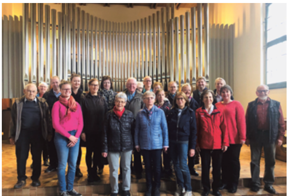
Orgelspaziergang, Besuchergruppe in der Grossen Kirche Schlieren