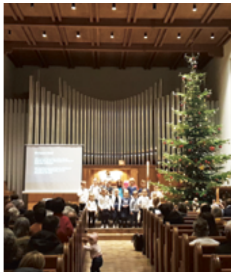
Kinderweihnacht, feierlicher-fröhlicher Familiengottesdienst